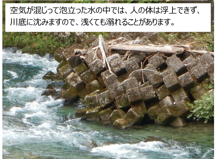
午渡橋上流 護床ブロック