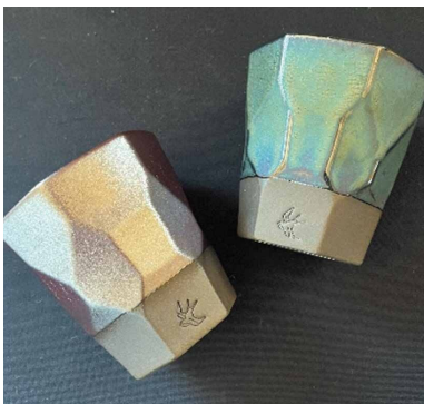
メタリック・ガーネットフリーカップ