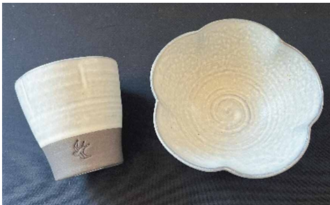
スノーホワイト小鉢・湯呑