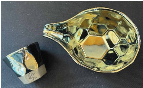
プラチナブルー酒器セット (盃・冷酒器)

本体サイズ: 盃/φ63×H55 (mm) 冷酒器/W150×D95×H65 (mm) 220ml