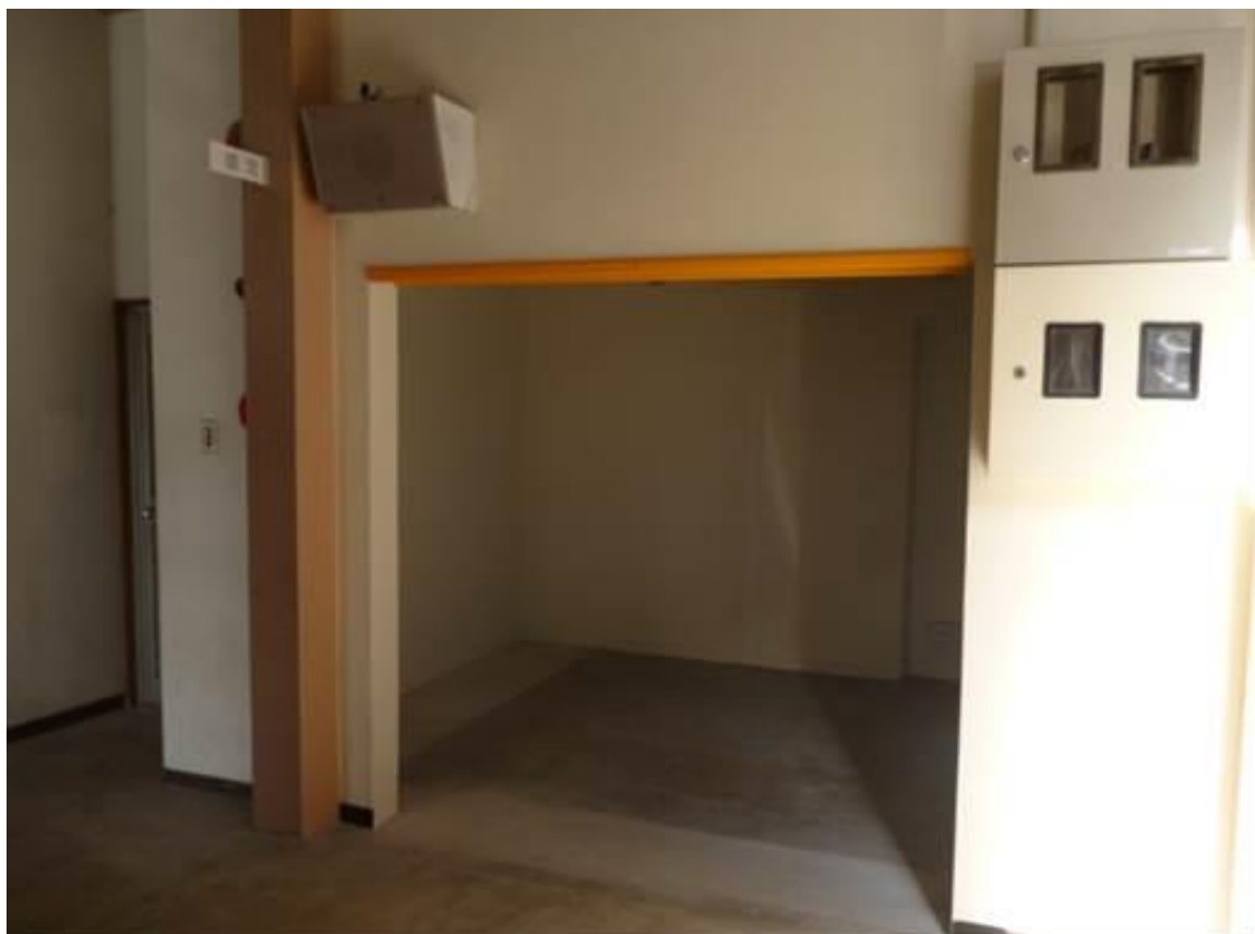
生徒昇降口側から自販機設置予定場所を望む 入り口部分の高さは約1.8m