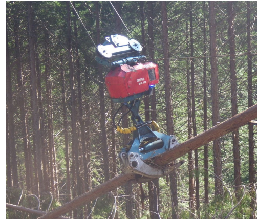
架線式グラップル