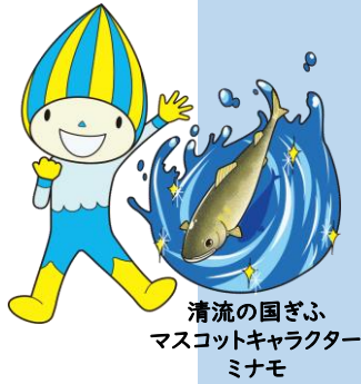
清流の国ぎふ マスコットキャラクター ミナモ

開催年度には、2か国から高校生を招へいし、次年度開催県が招へいする1か国の高校生と一緒に、総合開会式への出演、パレードへの参加などを通じて、国際交流を行います。