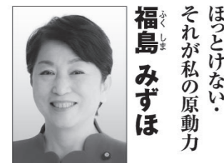
福島みずほ 【肩書き・経歴】 社民党党首・参議院議員・弁護士 【政策】 憲法をくらしに活かす政治を実現します！