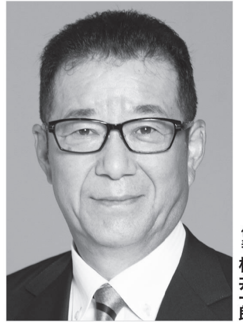
代表 松井 一郎