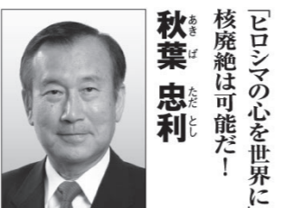
秋葉 忠利 【肩書き・経歴】 前広島市長・元衆議院議員・数学者 【政策】 核廃絶への実行可能な地図作成。 希望創り。