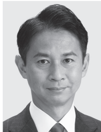
谷あい 正明 現3 元農林水産副大臣、党参議院幹事長。京都大学大学院修士課程修了。49歳。