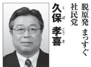
久保孝喜 【肩書き・経歴】 社民党脱原発・ 震災復興対策委員長 【政策】 生命と環境を脅かす原発のない 自然エネルギー社会