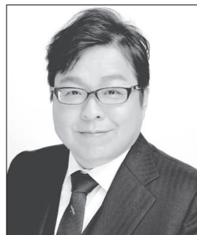
さくらい まこと 党首 桜井 誠