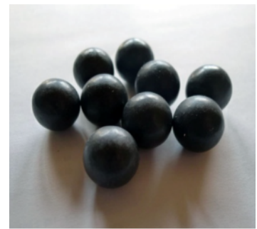
【遠赤外線セラミックボール】