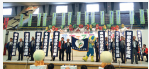
連合就農応援隊結団式の様子