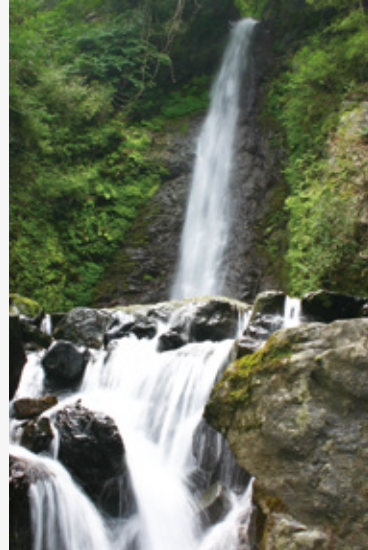
養老公園「養老の滝」

また、養老鉄道や関ヶ原古戦場など周辺の地域資源との相互連携により、本県のブランド力向上及び地域全体の活性化につなげていきます。