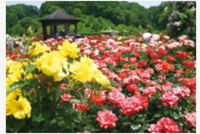
花フェスタ記念公園