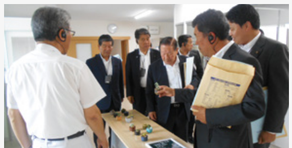
東和組立株式会社において、障がい者雇用の状況と仕事内容について説明を受けました。

教育・警察現場の現状、課題を把握するため、現場に勤務する警察官との意見交換を行うとともに、学校における障がい児の受入状況や特別支援学校卒業生の就労状況の調査を行いました。