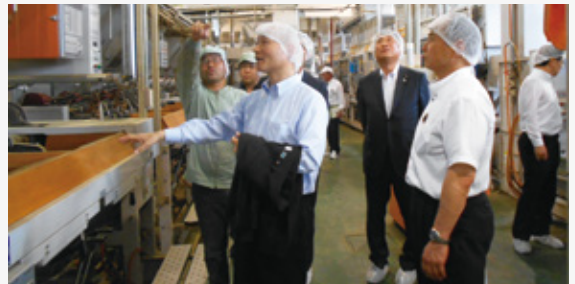
農事組合法人桂茶生産組合 製茶工場において、生産現場とGAP認証取得の取組みなどについて説明を受けました。

GAP認証を取得した農業生産法人や、建物に県産材を活用した保育所を視察し、農林業の現状と課題、その対策についての調査を行いました。