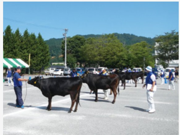
全国和牛能力共進会最終選考会の様子

議会を立ち上げ、繁殖雌牛を増やすための「繁殖センター」、担い手育成のための「就農研修施設」の早期整備に向けて取り組んでまいります。