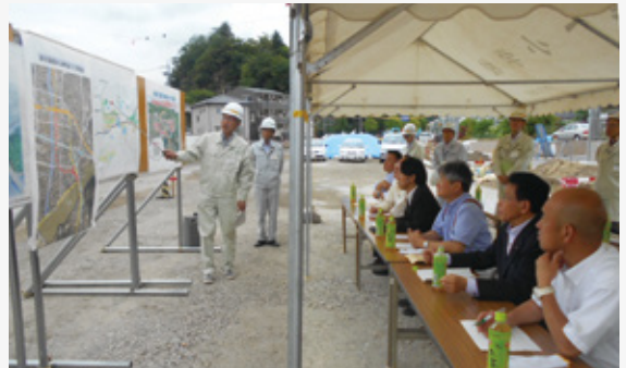
犬山東町線バイパス工事現場において、工事の目的や事業概要について説明を受けました。

県民の安全安心、便利な生活に繋がる道路や橋梁、県営都市公園の整備状況などの調査を行いました。