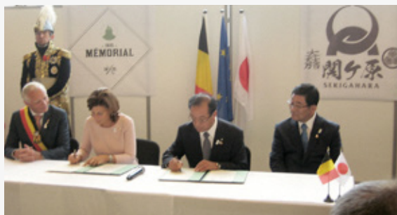
姉妹古戦場協定締結の様子

岐阜県では官民連携により「観光・食・モノ」を三位一体で売り込む「飛騨・美濃じまん海外戦略プロジェクト」を推進しています。