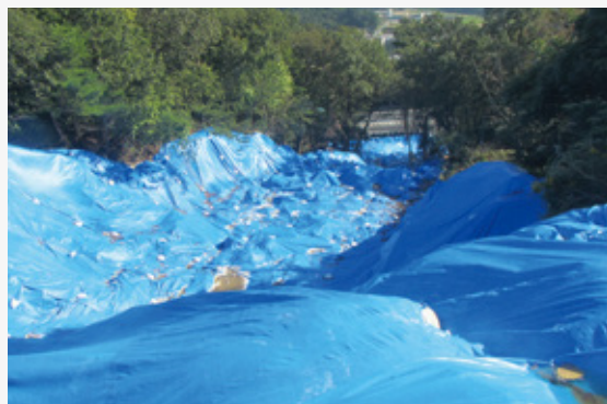
応急対策が講じられた崩落現場（H29.10.10撮影） （現場上部から中央自動車道を臨む）

今回の事案では、流出した土砂にシリカパウダーが含まれていたことが問題となりました。事案発生後にシリカパウダーを原料として使用する、他の事業者を対象に立入検査を行ったところ、不適正な処理は確認されませんでした。改めて廃棄物の適正処理に関する講習を行いました。今後もルールを周知徹底し、未然防止に努めていきます。