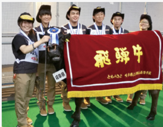
「ともみさと」飛騨高山高等学校（高山市）