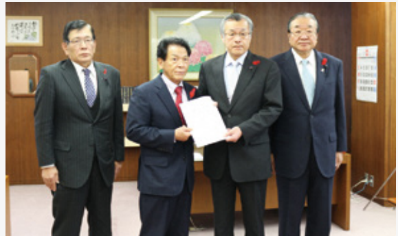
議長へ中間答申を行う足立委員長（左から2番目）、脇坂副委員長（左端）（議長室）