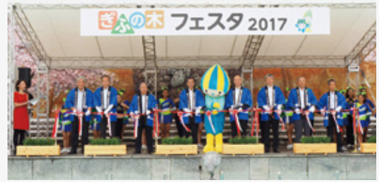
平成29年9月30日、10月1日に開催された「ぎふの木フェスタ2017」の様子