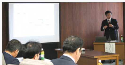
特別委員会の様子

質問 社会参加をすると認知症予防になるとのことですが、社会参加ができない人の対策はどのようにすればよいとお考えですか。