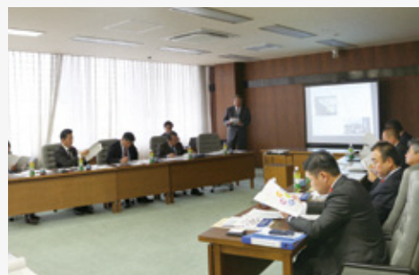
特別委員会の様子

質問 近年、新卒者の採用が難しいと聞いていますが、どのように取り組んでいますか。