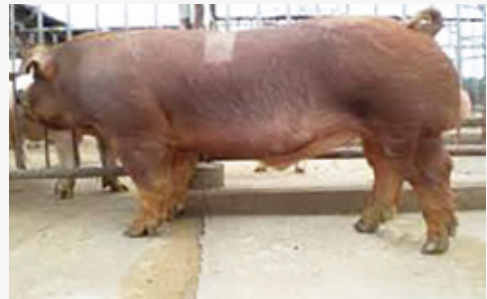
ポーノブラウンの外観

答弁 ポーノブラウンは、霜降り割合の高い本県が誇る種豚で、「飛騨けんどん・美濃けんどん」などのブランド豚でもポーノブラウンの活用が拡大しています。この種豚を管理していた畜産研究所で豚コレラが発生し、研究所の種豚の全てを失うこととなったため、この種豚の再造成に取り組めます。県内農家や県外の民間種豚場の協力を得て、5年後には10頭程度、15年後には80頭程度にまで増やす予定で、精液の凍結保存も進めてまいります。