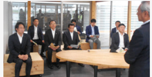
パレットピアおおのにおいて、施設概要について説明を受けました。

冬春トマトの新規就農者の育成を行う施設、昨年オープンした子育て支援施設を併設し広域防災拠点としての機能をもつ道の駅、多言語によるワンストップ相談窓口の現状と課題について調査を実施しました。