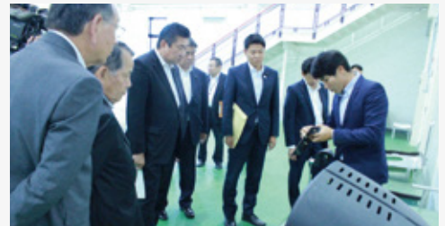
モノづくり教育プラザにおいて、航空機やエンジンの実物を活用した実習や航空機製造の一連の工程について、説明を受けました。

食品分野の研究開発、技術支援の拠点となる食品科学研究所、競技力向上のための施設であるスポーツ科学センター、航空宇宙産業の人材育成を図るモノづくり教育プラザの現状と課題について調査を行いました。