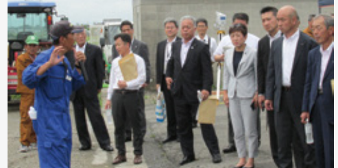
スマート農業技術の開発・実証プロジェクト農場において、自動運転トラクターや農業散布ドローンなどについて説明を受けました。

スマート農業を活用して超低コストの米生産に取り組む農場、木材の用途を広げるために開発された圧密加工技術を用いた木材工場などの現状と課題について調査を行いました。