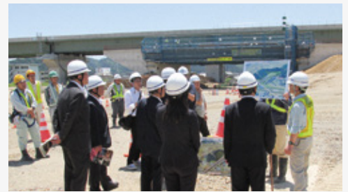
東海環状自動車道（仮称）高富ICの建設工事現場において、工事内容や今後の整備計画などについて説明を受けました。

昨年完成した障がい者用体育館や、今年度完成予定のICの工事進捗状況、昨年度開所した建設・建築業の担い手育成を図る拠点の現状と課題について調査を行いました。