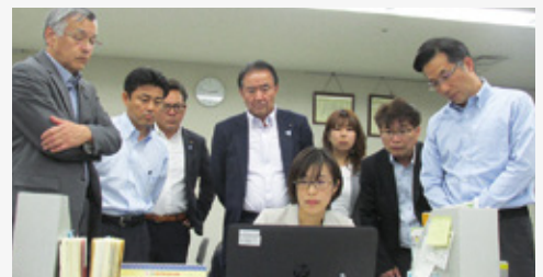
岐阜県県民生活相談センターにおいて、全国の消費生活相談情報を収集・蓄積するシステムについて説明を受けました。

妊娠期から子育て期まで、切れ目のない支援を行う子育て支援施設、保育士と保育所とを結びつける「保育の人材バンク」の役割を担う岐阜県保育士・保育所支援センターなどの現状と課題について調査を行いました。