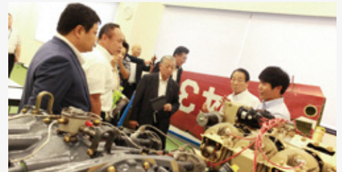
岐阜工業高等学校（モノづくり教育プラザ）において、教材として使用する航空機について説明を受けました。

高等学校における産業人材育成や「ふるさと教育」の取組み、小中一貫教育を推進する義務教育学校、110番通報を受理する県警通信指令課を視察し、教育・警察現場の現状・課題について調査を行いました。