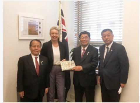
オーストラリア農業大臣との面談

岐阜県では、観光・食・モノを一体的にPRし、海外からの観光客の誘客や県産品の市場開拓・販路拡大を図る「飛騨美濃じまん海外戦略プロジェクト」を展開しています。