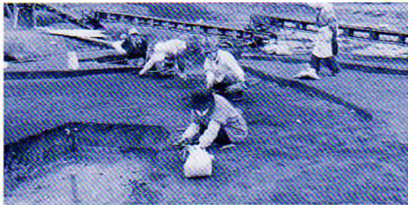
竪穴住居跡発掘の様子

これまでの結果、奈良時代の竪穴住居跡が50余軒見つかりました。これらの住居跡の数多く