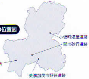
今回紹介した遺跡の位置図

おかげさまで、昨年以上の参観者数となりました。皆様から寄せられた声をもとに、さらによりよい企画を考えていきたいと思ひます。展示遺物の中からいくつかをピックアップし、再度紹介させていただきます。