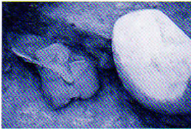
意図的に埋められた土器を発見

住居跡付近からは、たくさんの土器片が発見され、それらの中には、「きずな」22号の収蔵遺物紹介欄に掲載された村平遺跡の美しい土器に似たものも見つかりました。今後、整理作業の中で多くの破片を接合していくと、立派な土器になるのではないかと、今から楽しみです。下の写真は埋められた状態で発見された土器の様子です。