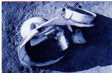
ほぼ完全な形で見つかった土器

今回の調査により、当時、このあたりに長い年月にわたって多くの人々が生活していた様子の一端を垣間見ることができ、さらには周辺地域とつながる一大集落跡の痕跡をたどることができました。