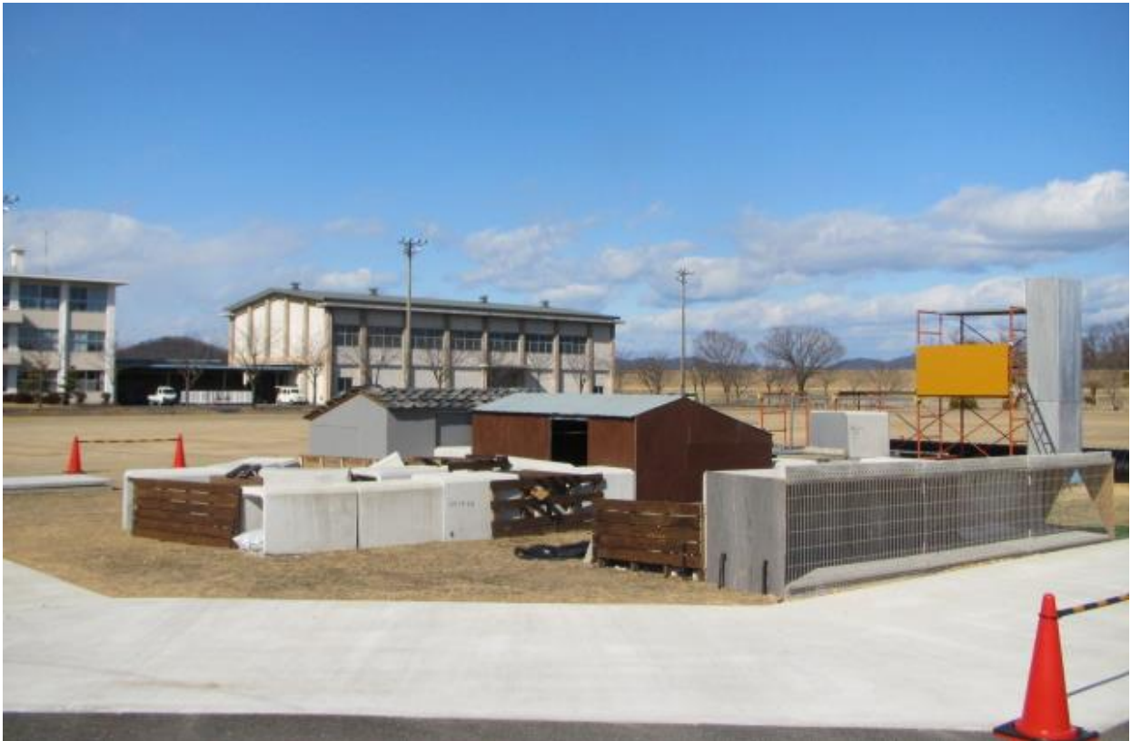
南西側より全体を撮影