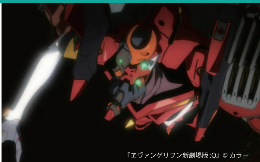
『エヴァンゲリオン新劇場版：Q』

スタジオカラーは劇場用アニメーション『エヴァンゲリオン新劇場版』シリーズを主として制作するとともに、WEB配信による短編映像シリーズ『日本アニメ（ーター）見本市』の制作や多くの外部作品にも参加する。また、デジタル部は3DCGによるアニメ作品も制作している。