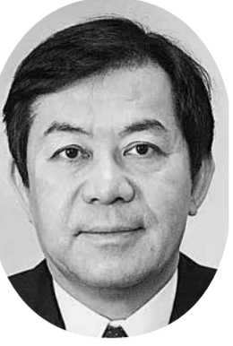
岐阜県第二区 自民党公認