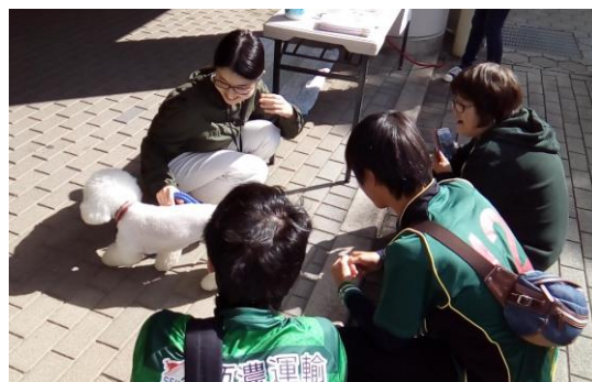
FC岐阜動物愛護イベントの様子