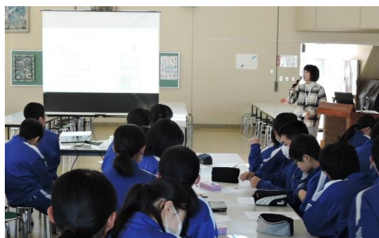
出前動物愛護教室の様子