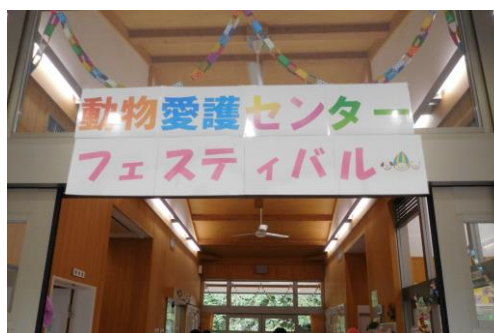
動物愛護センターフェスティバルの様子