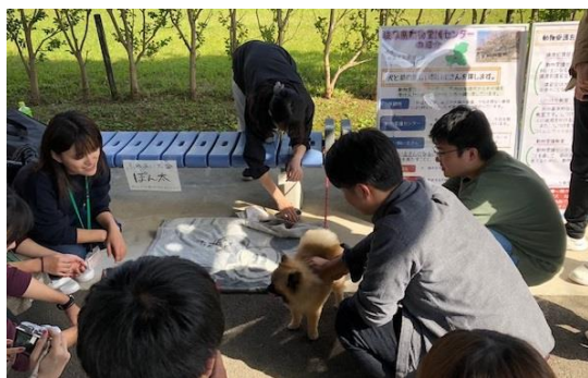
岐阜医療科学大学学園祭の様子