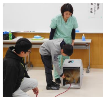
犬のトレーナー体験教室の様子