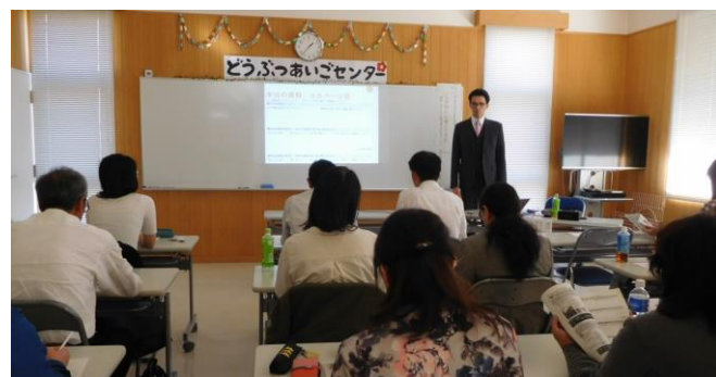
被災動物救援ボランティアリーダー講習会の様子