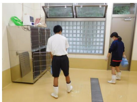
職場体験学習の様子