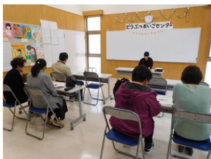
譲渡前講習会の様子