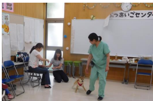
しつけ方教室の様子