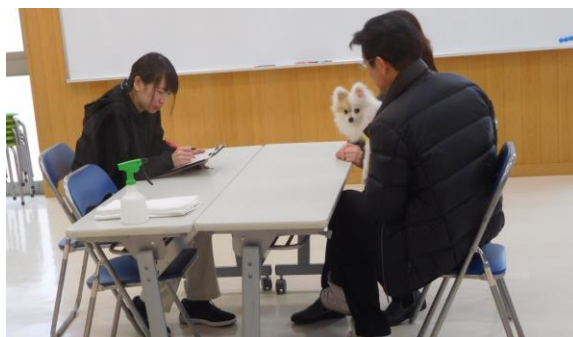
犬の飼い方・しつけ方個別相談の様子