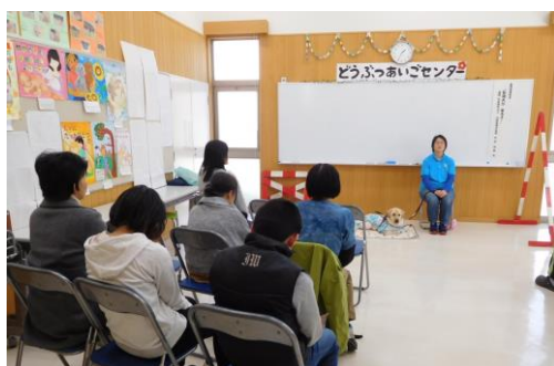
盲導犬がくるよの様子