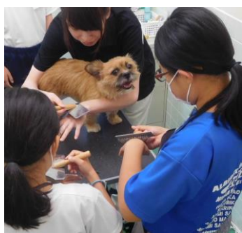
犬のトリミング体験教室の様子