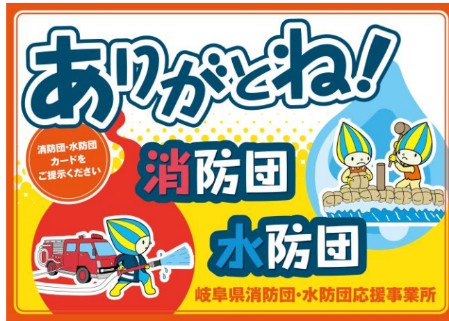
表 示 証

利用できる登録店舗等には、店舗入口など、よくわかる場所に「表示証」が掲出されています。また、岐阜県内であれば、所属する消防団の地域以外の登録店舗等でも利用することができます。