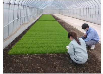
【育苗状況確認の様子】

飛騨地域では、コシヒカリなどの良食味うるち品種、特色あるもち、酒米品種が栽培されており、農業普及課では、今後も育苗管理や栽培管理にかかる情報提供などの支援を行っていく。