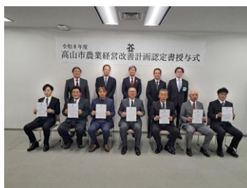
【新たな認定農業者】

飛騨管内には600を超える経営体が認定農業者となっており、農業普及課では、市村やJAと連携して、各経営体の経営改善計画の実現に向けて支援を進める。