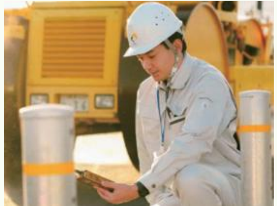
工事の進捗確認、検査、地元住民との交渉

机上の計算だけでなく、現場の空気を感じ、地域の人々と対話する。 技術者として総合力が身につく環境です！