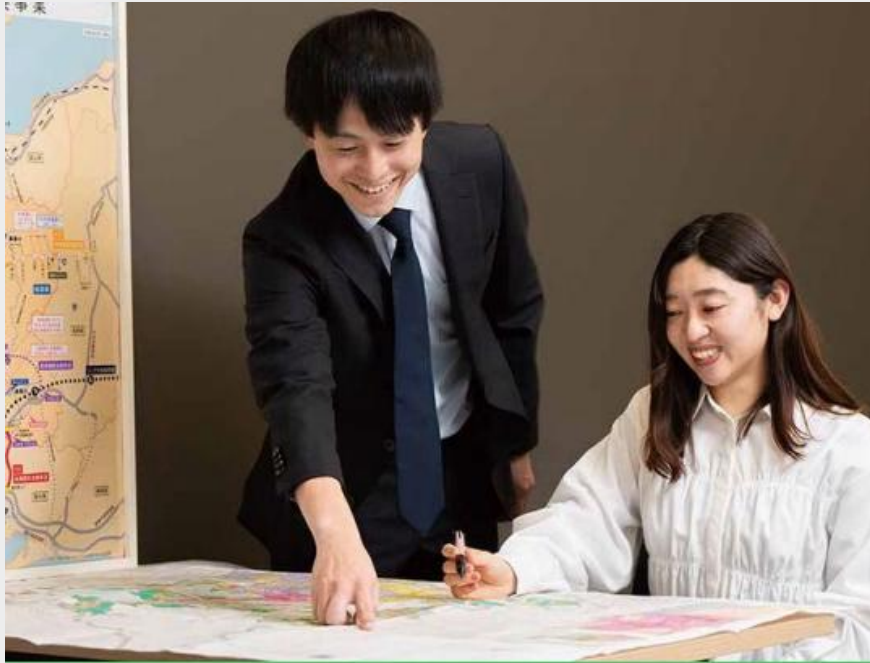
工事発注のための図面作成や積算、各種打合せ