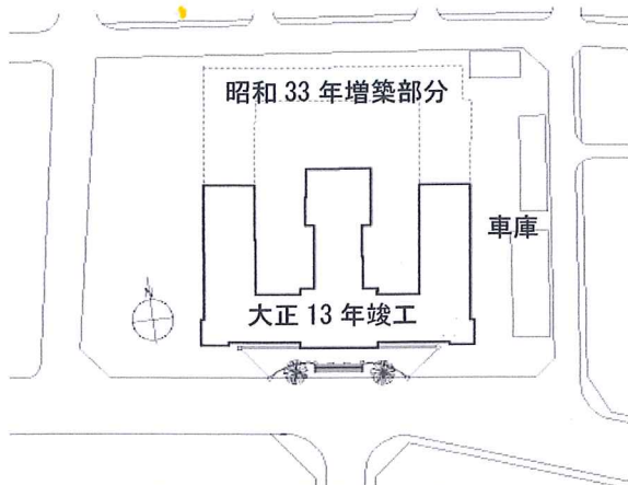
図1-3 旧岐阜県庁舎の敷地

延面積は2,849.125坪(約9,416㎡)、県会議事堂 其他延面積は501.750坪(約1,658㎡)であった。