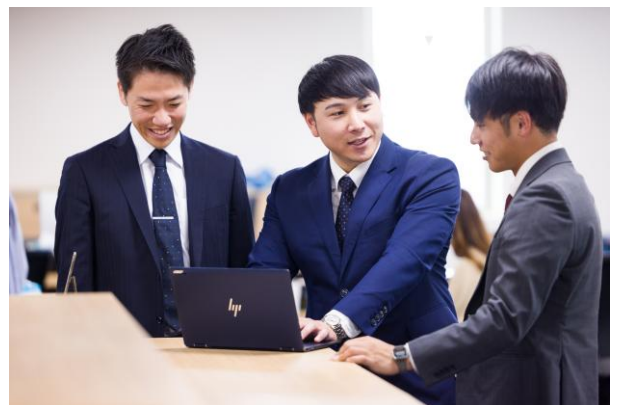
男性社員も職種に関わらず 育児休業を取得しやすい雰囲気が生まれている

今では、固定の顧客を持つ営業職など、従来は休みにくかった職種であっても、1～2カ月程度の育児休業を取得するなど、社内に休みやすい雰囲気が生まれています。