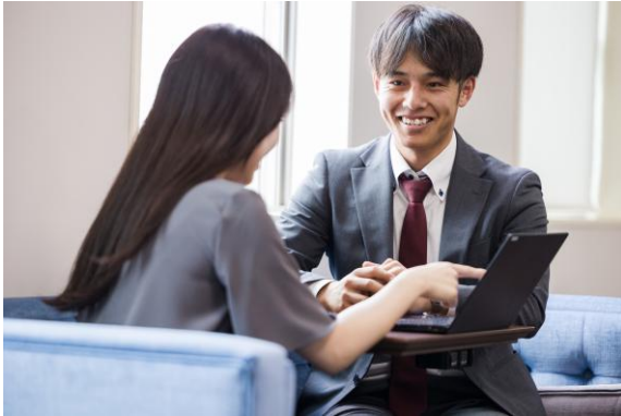
オフィス内はフリーアドレスで コミュニケーションも活発に

まずは、働く環境の整備です。若手社員を中心に、テレワークをはじめとした柔軟な働き方へのニーズが高まっていることを踏まえ、全社員にモバイルパソコンを支給。併せてペーパーレス化やRPA（ソフトウェアを活用してルーティンワークを自動化する技術）の導入を進め、出張時の直行直帰や育児や介護など家庭の事情がある場合などにリモートで業務を行える体制を整えました。