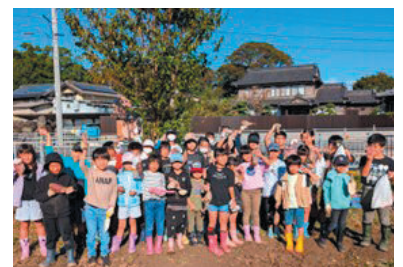
いもほり大会（空き地対策事業）

自治会役員の後継者について、「誰が担当しても可能な自治会体制」を構築し未来を展望した仕組みづくりが必要である。自治会の認知度把握として、ICTを利用したアンケートを実施して数値的な分析を行いたい。また、「ふれあい区民会議」や「防災訓練」などの自治会行事への参加者を、いかに増やしていくかが課題である。更に、空き家・空き地対策や独居の高齢者へのフォローなどの様々な課題への対応も必要となってきている。