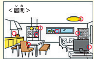
提案された危険な場所の事例

防災計画（初版）を基に、地域で取組む防災対策として「ふれあい区民会議」で小中学生の意見や考えも取入れ、防災計画（第2版）に反映させている。「ふれあい区民会議」では、自宅、通学路、学校におけるDIG※を行い、危険な場所をリストアップしている。