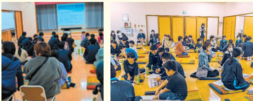
ふれあい区民会議