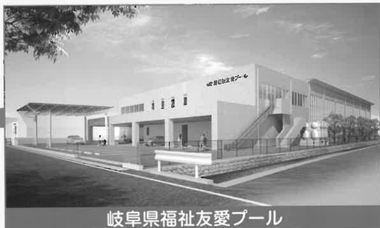
岐阜県福祉友愛プール