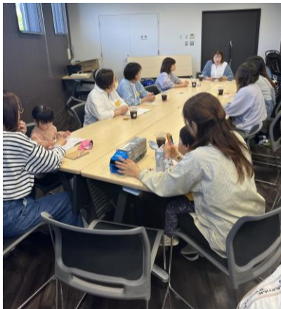
母親目線でアイデアを出し合うメンバー

また、定期的に行っているスタッフミーティングでは、母親目線で各自の体験や困りごとを話し合い、どうすれば子育て中の方に使ってもらいやすくなるかなど様々なアイデアを出し合っており、託児所の模様替えに生かしているほか、病後児保育など、新たなサービス展開も検討しています。