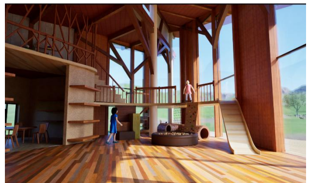
(仮称) いび木遊館の内観イメージ