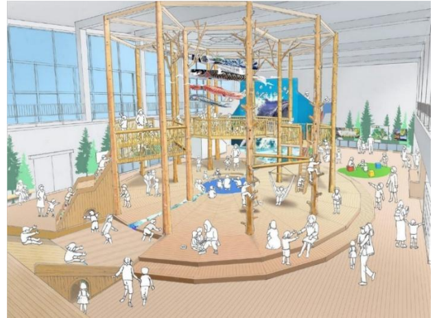
(仮称) ぐじょう木遊館の内観イメージ