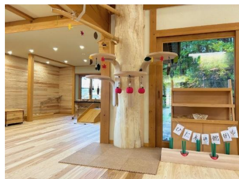
ひだ木遊館 木っずテラス (R6.11～)