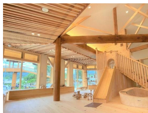
なかつがわ 森の木遊館 (R6.8～)