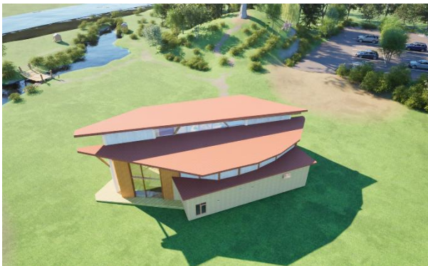
(仮称) いび木遊館の外観イメージ