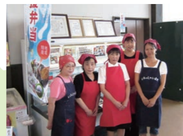
4 ふる里レディース