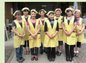
2 ふれあいバザール生産物直販組合