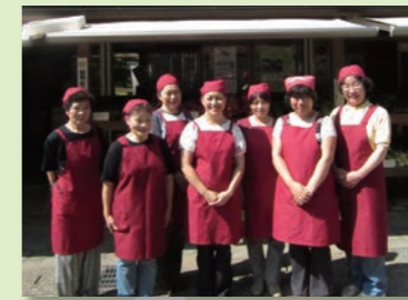
8 農事組合法人なかのほう不動滝やさいの会