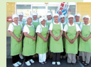
3 JAIいび川女性部加工グループ