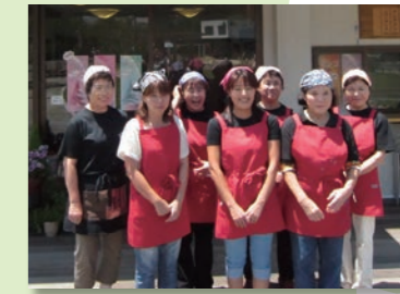
9 (株)山岡のおばあちゃん市