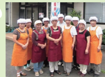
5 川合農産加工グループ土里夢