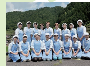
6 (有)てまひまグループ