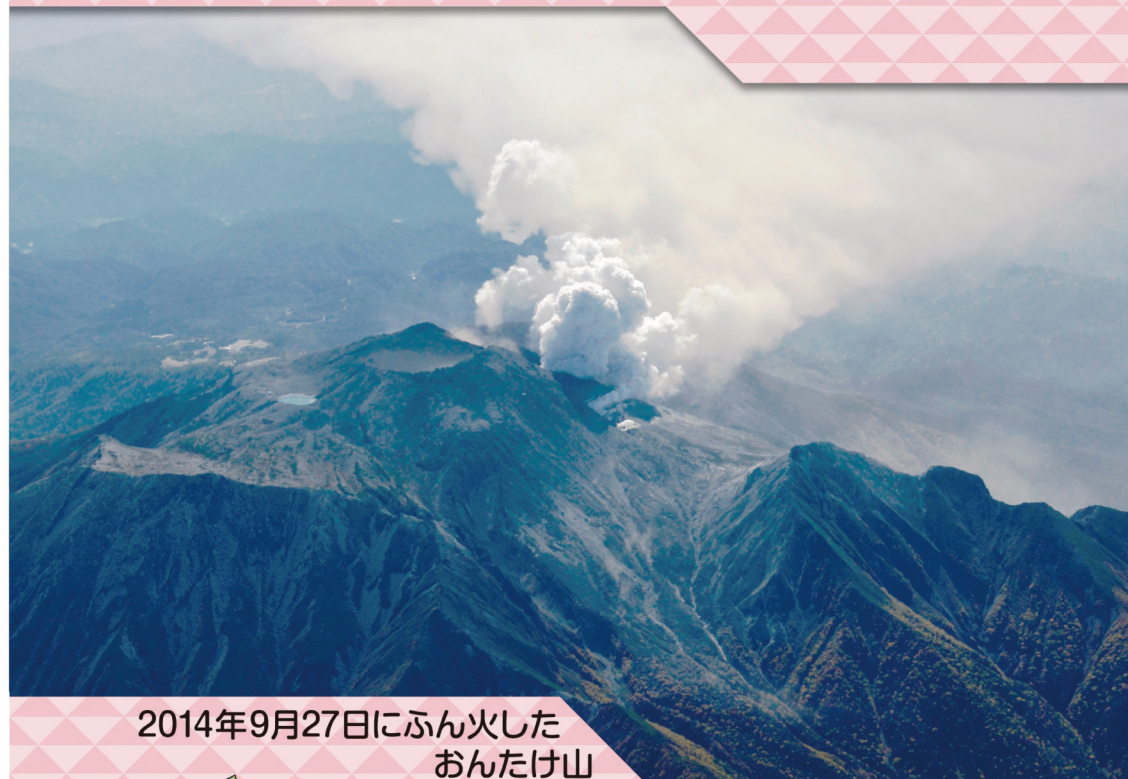
2014年9月27日にふん火した おんたけ山