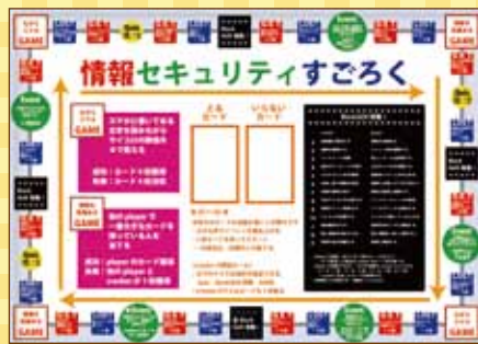
県立岐阜総合学園高等学校 マルチメディア部制作

〒500-8570 岐阜県岐阜市数田南2-1-1 岐阜県私学振興・青少年課内 (公社)岐阜県青少年育成県民会議