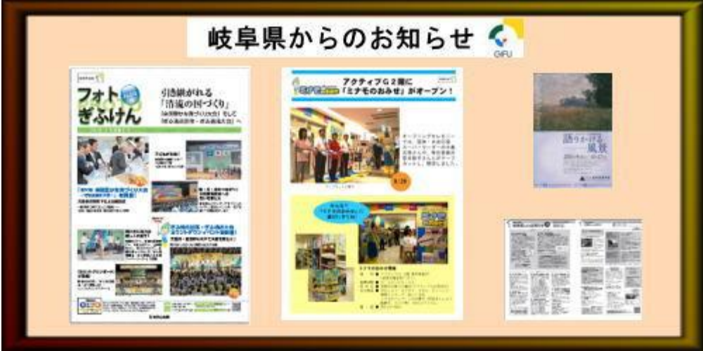
▲お知らせボード(イメージ)