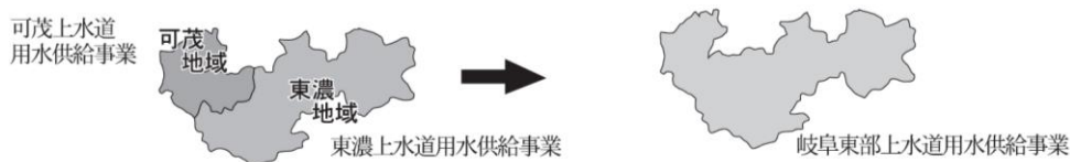
事業統合のイメージ図

なお、給水規模は、創設当時の6市4町の約28万人から、約46年を経過した現在は、7市4町の約50万人の水道水を供給するまでに至っている。