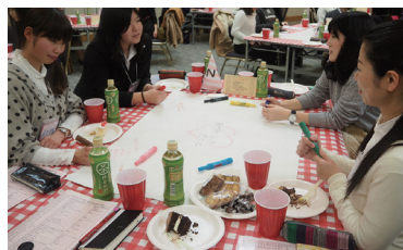
女子高校生、女子大学生が就職や将来に向けての夢、不安、疑問を先輩と語り合いました