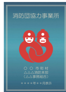
消防団協力事業所表示証

消防団協力事業所表示制度(総務省消防庁ホームページ) https://www.fdma.go.jp/relocation/syobodan/data/policy/cooperation-system/