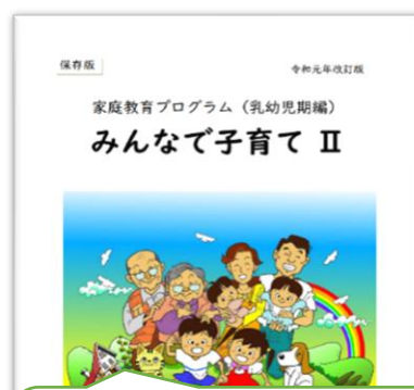
乳幼児期編 (R2.各園に配布) 例) P81 スキンシップ