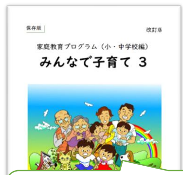
小・中・義学校編 (R3.各小・中・義学校に配布) 例) P98 反抗期