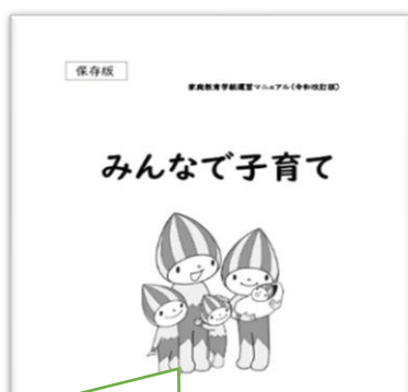
令和改訂版 運営マニュアル (R4.各園・小・中・義学校に配布) 例) P5 子育てサロン型