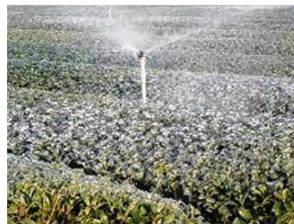
写真7 散水法(散水の様子)