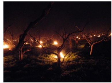
写真4 燃焼法（カキ園）