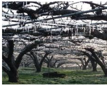
写真3 散水法（ナシ園）