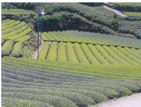
写真5 被害茶園の様子

晩霜害は、新芽が約 -2^{\circ}\text{C} の温度で細胞が凍結し、それが解凍されるときに細胞壁が破壊され枯死する。凍結した時期や程度により差があるが、摘採が近くなって凍霜害に遭うと、一番茶の収量は大幅に影響を受け、その年の生産に大きな打撃を受ける。