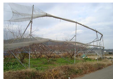
写真1 防風ネットの巻き上げの様子