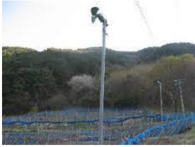
写真2 送風法（防霜ファン）