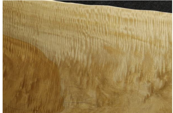
トチノキの縮歪の例