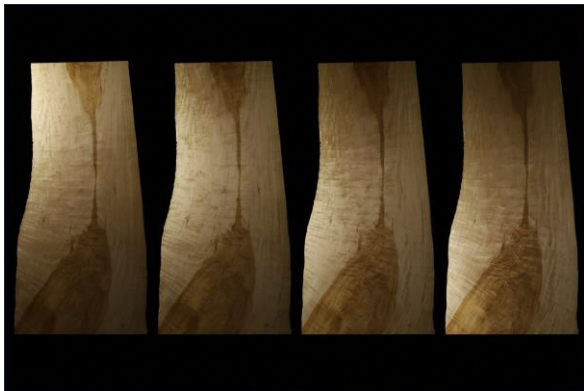
撮影された画像の例（トチノキ銘木）