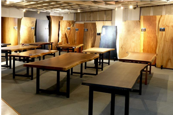
ショールームに展示される銘木