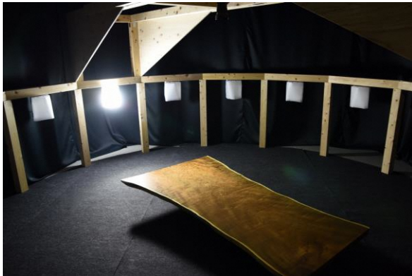
銘木の変角照明撮影装置