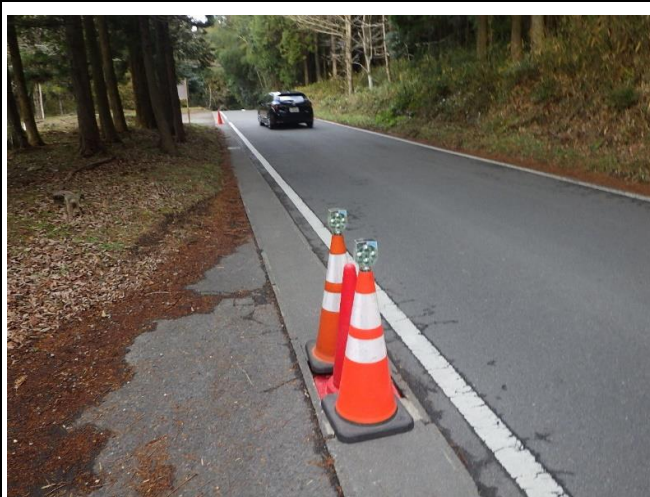
盗難箇所 南から2箇所目(南から北へ撮影) セーフティコーン設置済み