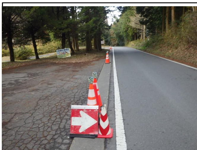
盗難箇所 南から1箇所目(南から北へ撮影) セーフティコーン設置済み