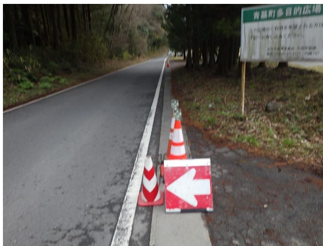
盗難箇所 南から3箇所目(北から南へ撮影) セーフティコーン設置済み