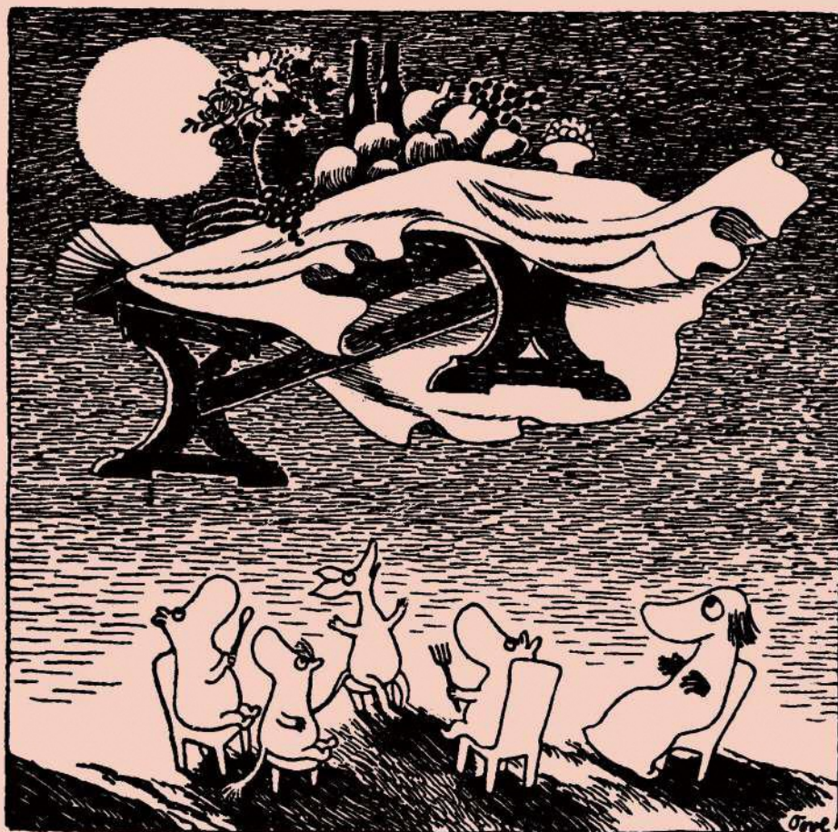
《たのしいムーミン一家》1948年 ©Moomin Characters™

2023 12.16 SAT. — 2024 3.3 SUN. 岐阜県現代陶芸美術館 ギャラリーII A室