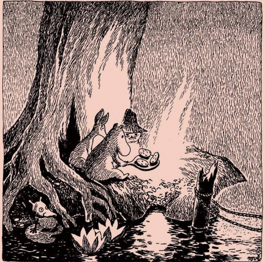
《ムーミン谷の暮》1946年 ©Moomin Characters™

食べることと、共に生きることにつながりを感じられる、ムーミンたちの食卓をご覧ください。