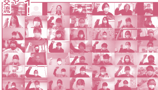
(令和4年度 オンライン開催時の様子)