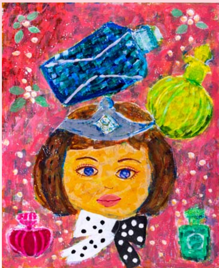
ふれあいアートステーション・ぎふ 令和4年度知事賞作品