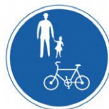
「普通自転車等及び歩行者等専用」