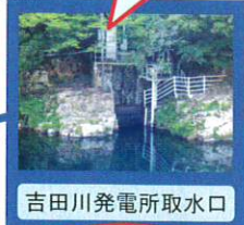
吉田川発電所取水口