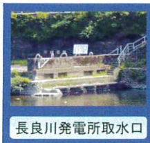
長良川発電所取水口