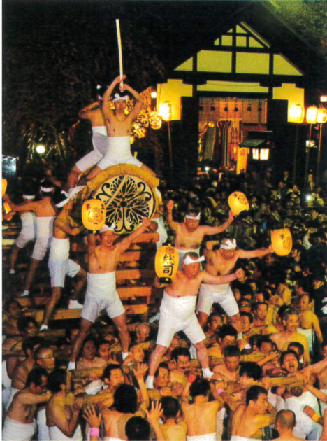
起し太鼓打ち出し場面 ※展示は太鼓のレプリカ