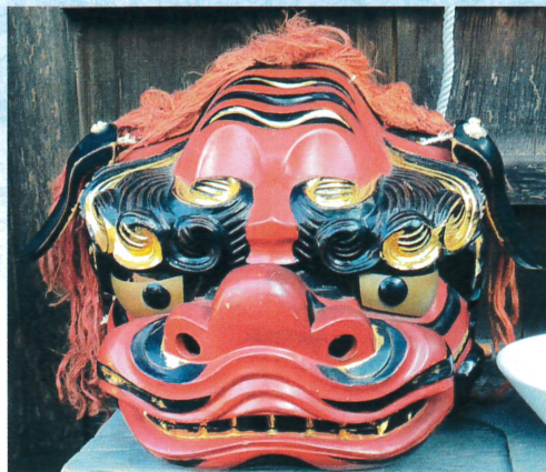
八百津町舟形だんじり(芦渡組)模型(所蔵:八百津町教育委員会) 養老町 獅子頭(栗笠の獅子舞)(所蔵:栗笠の獅子舞保存会)