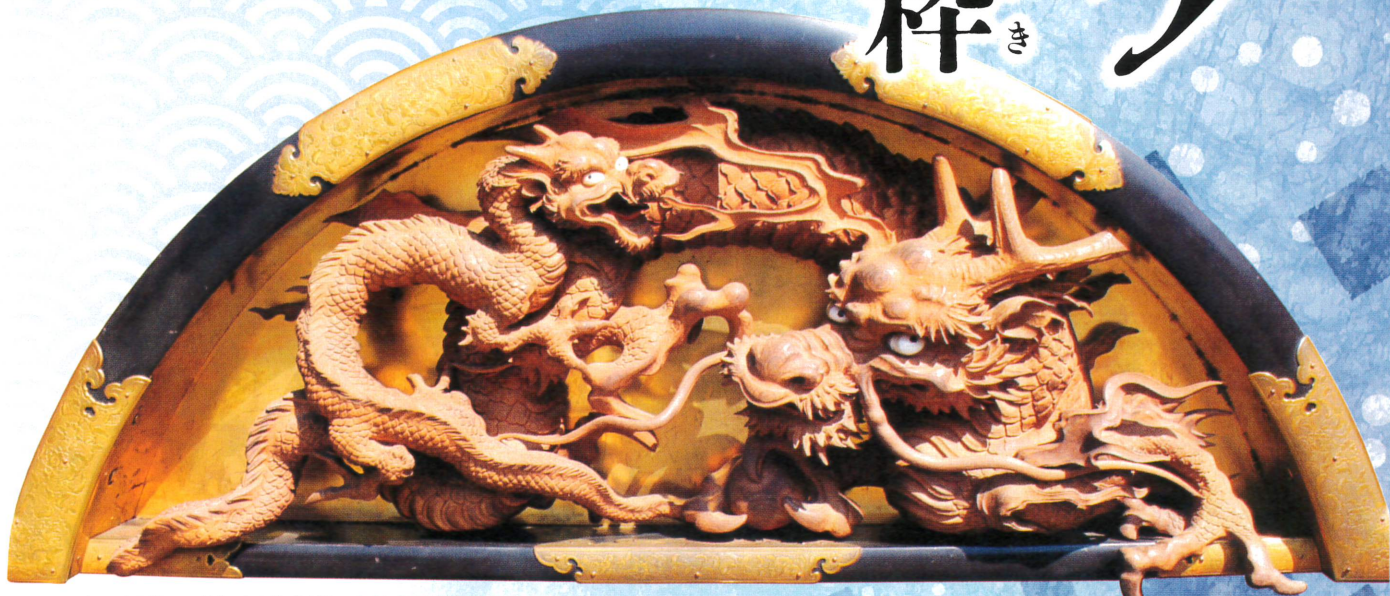
恵比須臺彫刻(親子龍)