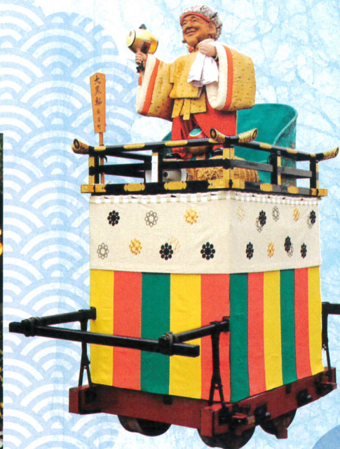
大垣祭 大黒軸 ※展示は模型