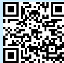
申し込みフォーム