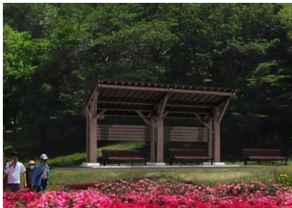
ぎふワールド・ローズガーデン 東屋

※返還木材は、上記に加え、森林文化アカデミーの授業や、関係市町でベンチなどへの活用が予定されています。また、各施設には東京オリパラ大会で使用した木材とわかるように銘板や焼き印を施しています。