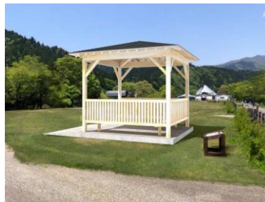
清流長良川あゆパーク 東屋