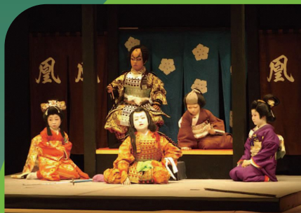
いび祭子ども歌舞伎保存会