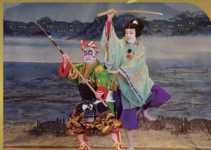
東美濃こども歌舞伎