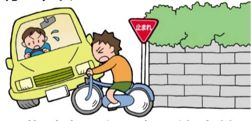
指定場所一時不停止等