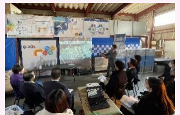
株式会社エルコムを視察

(一社)HOKKAIDO ADAPTIVE SPORTSにおける障がい者スポーツの拠点づくりの取組や、株式会社エルコムが開発した産業廃棄物をエネルギーに変えるシステムの概要等について調査しました。