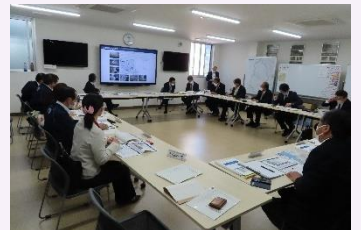
球磨村役場防災センターを視察

北九州市環境ミュージアムにおける環境学習・交流総合拠点施設としての取組や、令和2年7月豪雨災害で被害を受けた球磨村でのコロナ禍における災害対応の現状と課題等について調査しました。