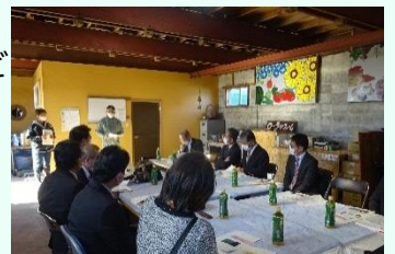
ローラ・ファームを視察

ローラ・ファームにおける羊の堆肥を利用した循環型農業の取組や、青森県内の林業、木材加工・施工業者、青森県林業研究所など官民が一体となって林業活性化や県産材の付加価値向上を目指す「SOMA青い森プロジェクト」の取組等について調査しました。