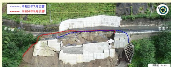
乗鞍スカイライン崩壊現場

乗鞍スカイラインは、地域観光を支える重要な道路であるため、早期復旧に向け全力で取り組んでいきます。