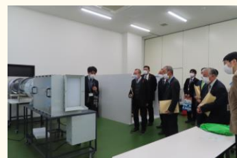
モノづくり教育プラザを視察

岐阜工業高等学校の概要や平成29年4月に設置された「モノづくり教育プラザ」の活用状況について説明を受けたあと、モノづくり教育プラザなどの施設や新しく導入された実習設備などを使った、授業・実習の様子について視察をしました。