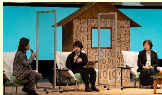
エンジン01in岐阜の様子