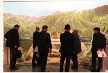
立山カルデラ砂防博物館を視察